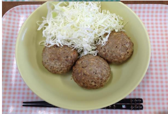
ローソン げんこつメンチ3個(衣なし)

エネルギー: 762kcal 糖質+食物繊維: 40.6g (21.3%) 脂質: 55.4g (65.5%) たんぱく質: 25.3g (13.2%) 塩分: 2.6g