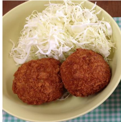
ローソン げんこつメンチ2個

エネルギー: 762kcal 糖質+食物繊維: 40.6g (21.3%) 脂質: 55.4g (65.5%) たんぱく質: 25.3g (13.2%) 塩分: 2.6g