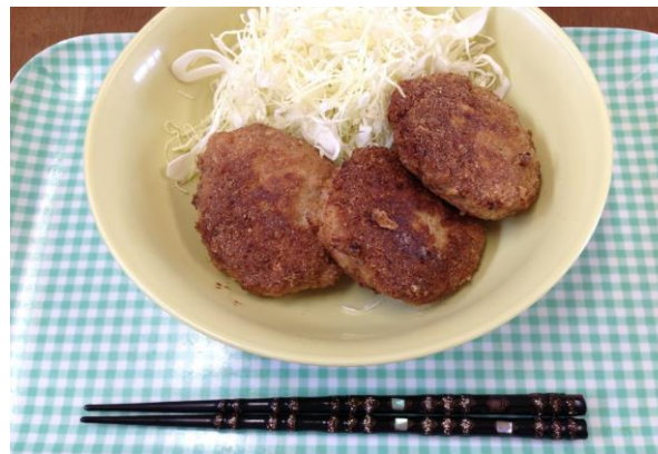
自家製メンチカツ3個

エネルギー: 673kcal 糖質+食物繊維: 38.5g (23.0%) 脂質: 42.5g (57.0%) たんぱく質: 34.1g (20.0%) 塩分: 3.1g